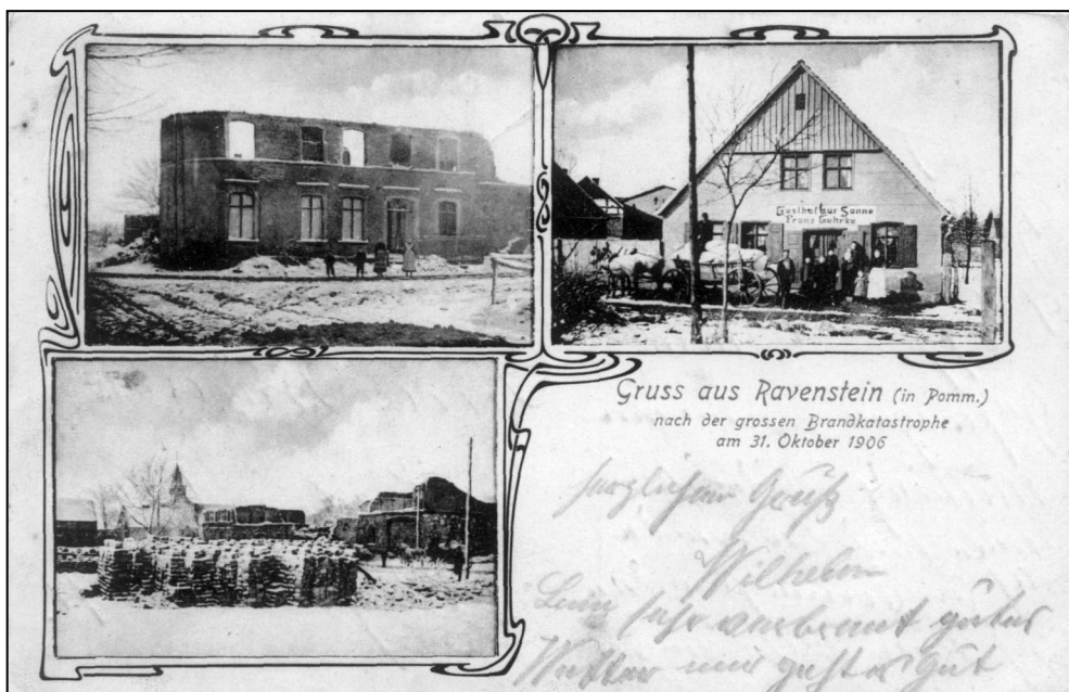
Ilustr. 4. Poczтівka przedstawiająca Wapnicę po wielkim pożarze 31 października 1906 r. Brak wydawcy; 1906; światłodruk; MS/H/1447