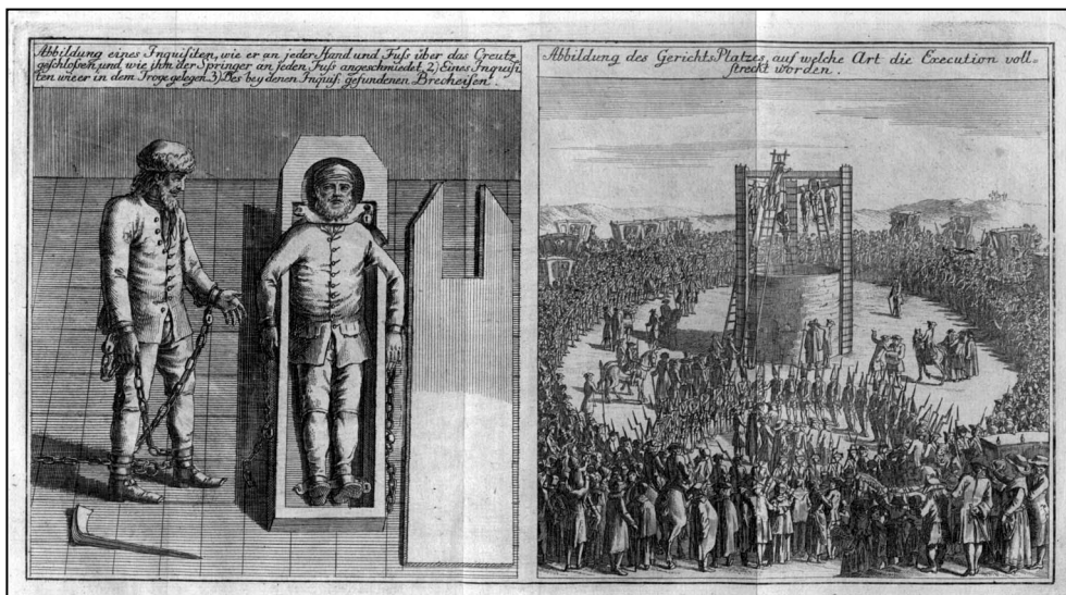
Ilustr. 1. Uwięzienie i stracenie bandy rozbójników w Stargardzie w 1772 r., H. Siemssen, Szczecin; 1872, litografia (na podstawie miedziorytu z 1772 r., wyd. Johann Ludewig Kunst, Witwe, Stargard); MS/S/863