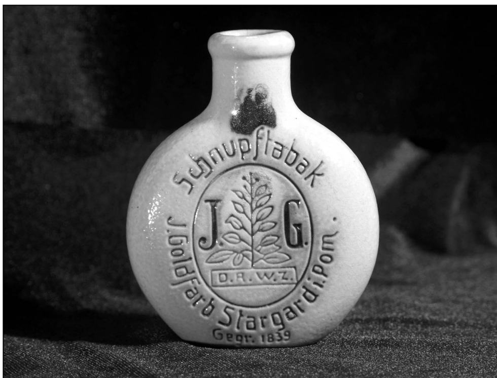
Ilustr. 2. Tabakiera, J. Goldfarb, Stargard; po 1919 r.; kamionka; MS/S/861